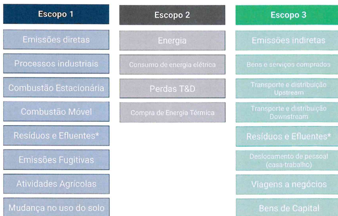
Imagem 1: Detalhamento dos Escopos

*A serem contabilizadas no escopo mais adequado