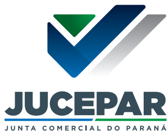
VERSÃO PREFERENCIAL POSITIVA