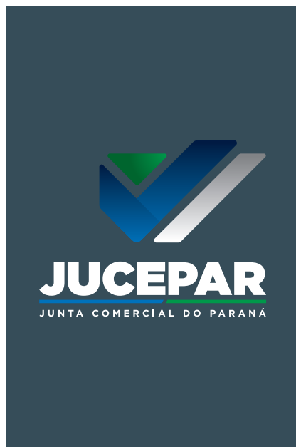
VERSÃO PREFERENCIAL NEGATIVA